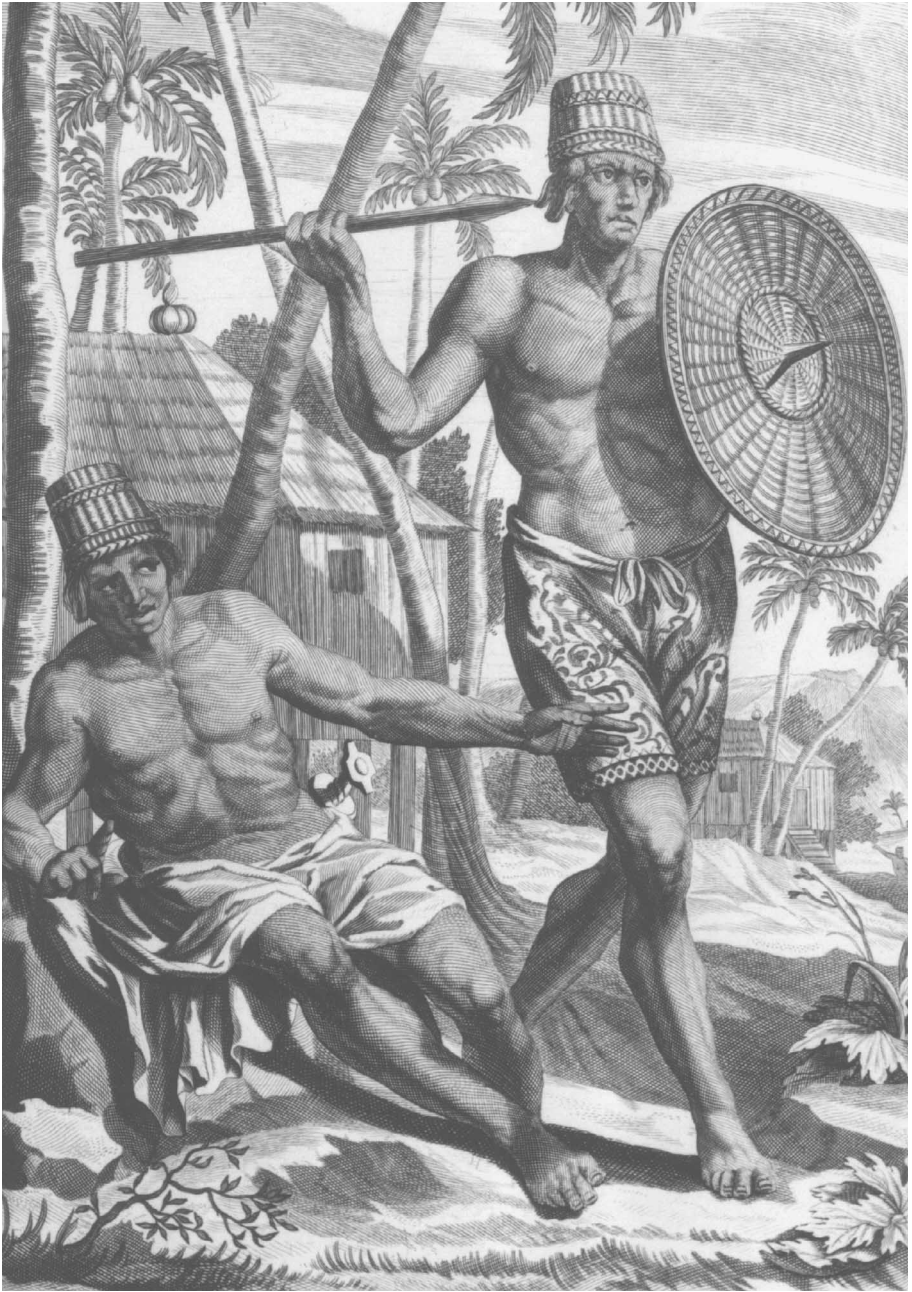
Afbeelding 27. Buginese strijders. In: J. Nieuhof, Zee en Lantreise door verscheide gewesten van Oostindien , t.o.p. 218. Amsterdam: Van Meurs, 1682.